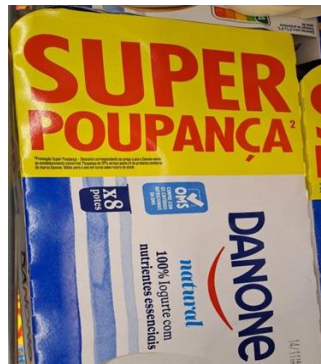
Figuras 5 e 6 – “SUPER DOURADAS” e “SUPER POUPANÇA”