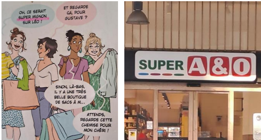
Figuras 12 e 13 – “SUPER MIGNON” e “SUPER A&O”