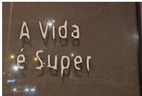
Figuras 7 e 8 – “Super Fina” e “A vida é Super”