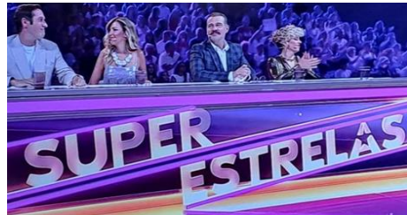
Figuras 1 e 2 – Programa da RTP-1, “SUPERESTRELAS” e “SUPER ESTELAS”