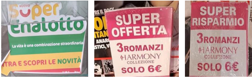
Figuras 9, 10 e 11 – “Nuovo Super Enalotto”, “SUPER OFFERTA” e “SUPER RISPARMIO